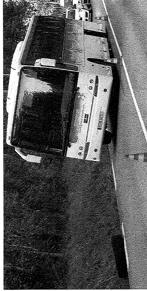
Le bus de la SAT qui transportait une vingtaine de collégiens et lycéens avait perdu sa roue arrière suite à une rupture d'un goujon le 15 septembre dernier à 7 h 30.