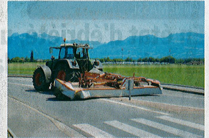
Plusieurs agriculteurs en colère ont fait barrage avec leurs tracteurs pour empêcher le passage des gens du voyage.

mande de renforts liée à ce type d'intervention, le ton est alors rapidement monté entre la communauté et les agriculteurs locaux : ceux-ci ont dans un premier temps bloqué les routes d'accès au terrain, avant que ne surviennent une échauffourée et le recul d'une caravane dans un tracteur. Vers 13 h 30, le commandant Besson et les gendar-