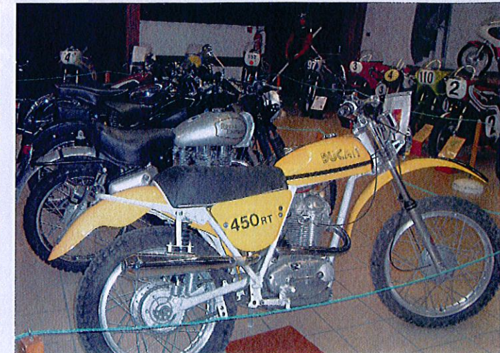
▲ Vous connaissez le 450 Scrambler Ducati... mais peut-être pas cette rare version R/T de 1975 (d'origine, non importée en France) davantage grée pour le tout-terrain.

La dernière édition, les 26 et 27 mars derniers, a réuni plus d'une centaine de motos, toutes dans un état exceptionnel. « Avec le week-end ensoleillé, le rendez-vous a battu son record de visiteurs. Et puis, se rendre à Arthaz est un vrai bonheur avec un panorama sur le Mont Blanc d'un côté et le lac Léman de l'autre. Je me suis offert une petite arsouille jusqu'au mont du Sa-