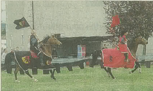
La troupe équestre du comité des fêtes.

L'entrée de la fête est gratuite, tout autour de l'église.