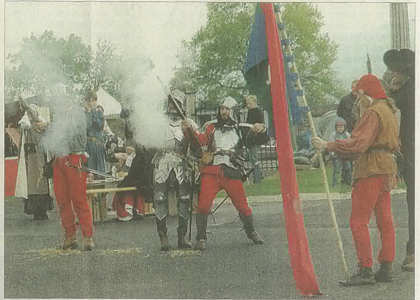
Le tir d'artillerie avec la compagnie de l'Herpaille Saint-Martin.