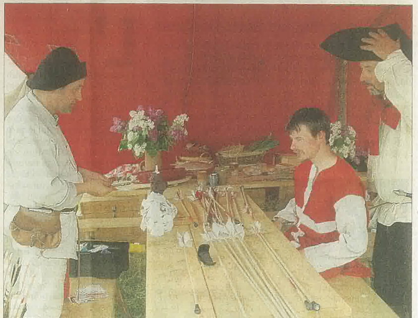
Fabrication de flèches par les archers de Sabaudia.