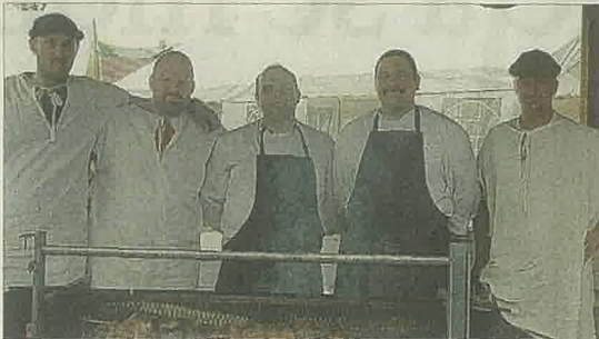
Les cuisiniers du comité des fêtes ont concocté des cuisses de bœuf à la broche.