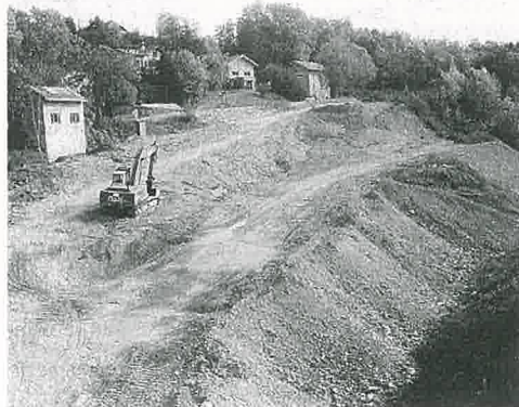
Le maire d'Arthaz craint qu'en cas d'éboulement les maisons situées en aval soient menacées.

D'où ce cri d'alarme : « Il y a une mise en danger de la vie d'autrui ! » Le maire, qui en est conscient, a pris un arrêté argumenté le 16 octobre ordonnant à la société Barbaz de cesser toutes rotations de poids lourds et tous travaux en se demandant s'ils répondent aux prescriptions de Géo Arve. La question faisant désormais débat, une réunion a eu lieu à la mairie le 27 octobre. Laquelle sera suivie d'un communiqué de presse à défaut de sa présence... J.-M.H.