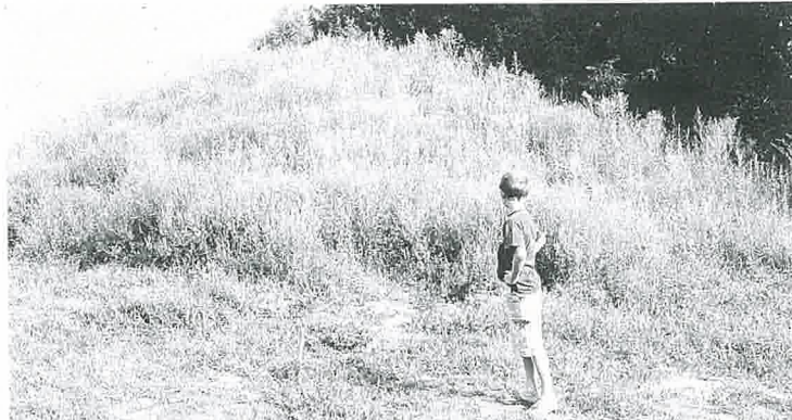
Originaire d'Amérique, l'ambrosie se répand surtout dans les friches ou terrains récemment retournés. Actuellement en fleur, elle provoque de graves allergies.

jaune, se dressent en épis. La plante dite à feuille d'armoise ("ambrosia artemisiifolia L.") fait partie de ce que l'on appelle couramment "les mauvaises herbes" et est de la même famille que le tournesol (astéracées ou composées). Une morphologie assez anodine qui ne mériterait même pas notre regard. Pourtant, la coquine nécessite d'être connue pour être mieux détruite car elle génère, dès la mi-août et jusqu'à octobre, des rhinites, des conjonctivites, des trachéites, de