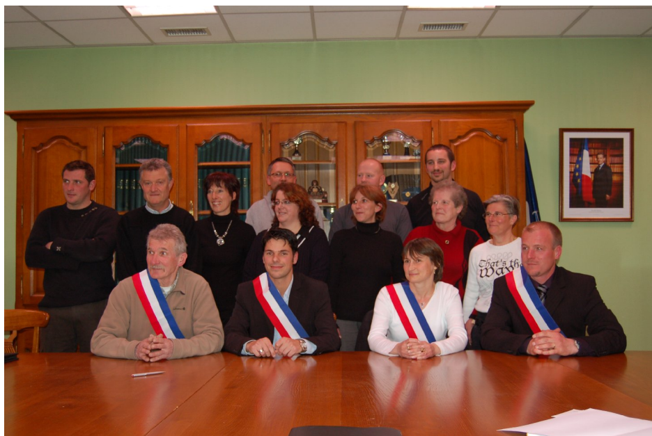
L'équipe du conseil municipal